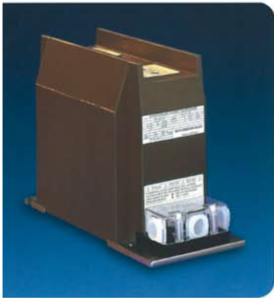
Sonderbauform mit verlängerten Kriechstrecken special design for enlarged creepage distances